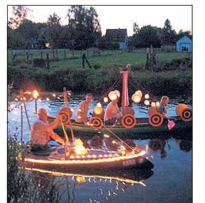
Romantischer Anblick: Die Lampionfahrt auf der Ems gehört zur Tradition des Kanu-Clubs Wiedenbrück-Rheda.