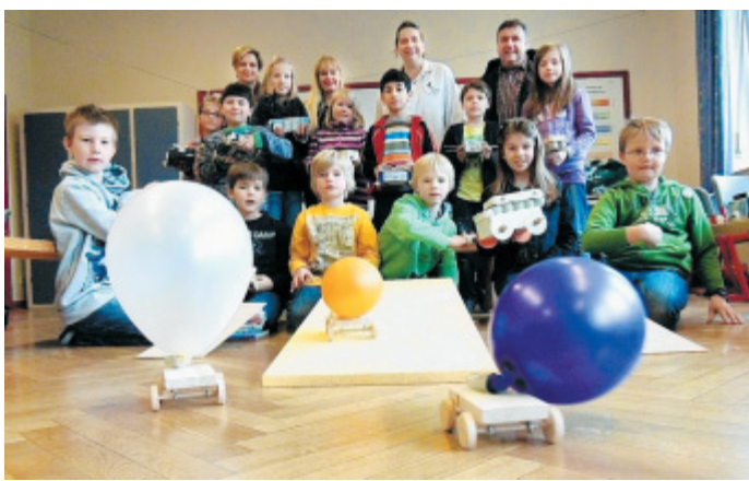
Gelungenes Projekt: Die Schüler der dritten Klassen präsentieren ihre selbstgebaute Fahrzeuge.

zweiten Klassen kleine Schiffe nach Skizzen mit unterschiedlichen Antrieben wie Segel, Schaukelrad und Düsenantrieb und Bewegungsspielzeuge wie Papierflieger, Propeller und Farbkreisel gebaut. In den zwei dritten Klassen waren Automobilkonstrukteure für das Kreieren von Fahrzeugen aus Alltagsmaterialien und Holz gefragt, in den vierten Klassen erfuhr die Kinder, wie man einen Stromkreis auf-