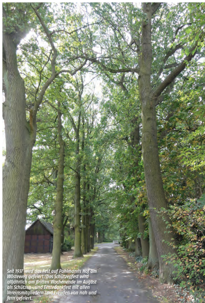
Seit 1937 wird das Fest auf Pohlmanns Hof am Wösteweg gefeiert. Das Schützenfest wird alljährlich am dritten Wochenende im August als Schützen- und Erntedankfest mit allen Vereinsmitgliedern und Freuden von nah und fern gefeiert.