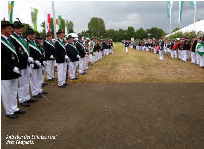
Antreten der Schützen auf dem Festplatz.