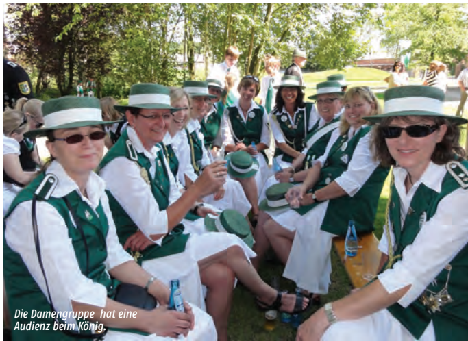
Die Damengruppe hat eine Audienz beim König.