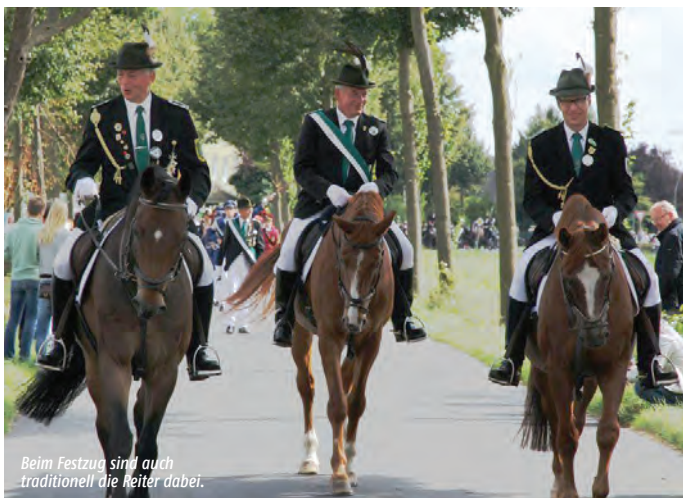
Beim Festzug sind auch traditionell die Reiter dabei.