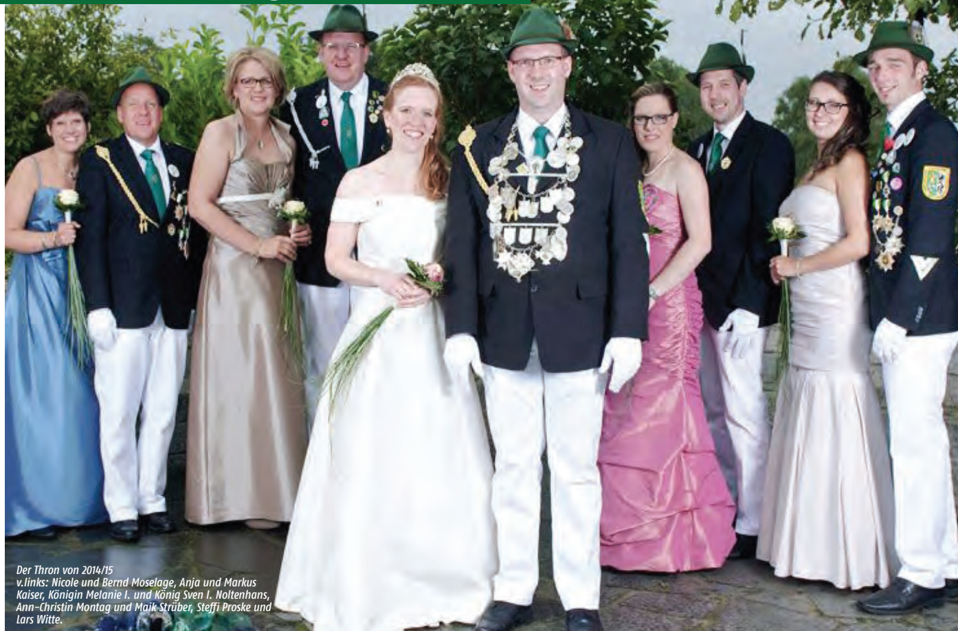
Der Thron von 2014/15