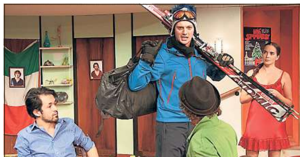
„Achtung Deutsch!“ heißt die Multi-Kulti-Komödie, die im April im Ratsgymnasium zu sehen ist.