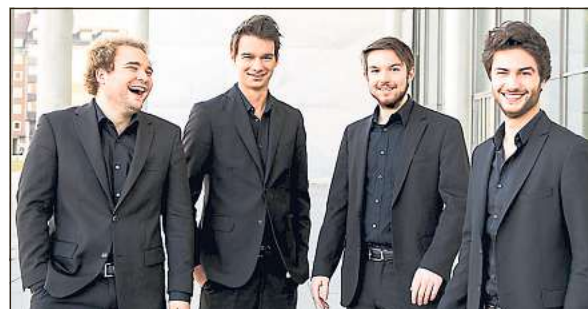
Das „Goldmund-Quartett“ macht am 24. März in der Orangerie des Schlosses Rheda Station.