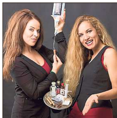
Suchtpotenzial birgt ihr Auftritt im Reethus am 31. März.