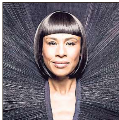
Malia kommt mit Nalawi-Blues in die Orangerie nach Rheda.