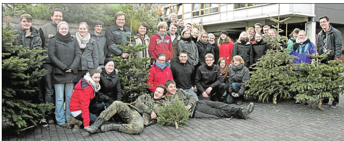
Die Messdiener von St. Clemens Rheda sammelten im Gemeindegebiet 600 Tannenbäume ein.

arbeit. Eine Mittagspause fand im St.-Elisabeth-Altenheim statt, wo sich die Helfer stärken und aufwärmen konnten. Danach machten sich alle wieder an die Arbeit, und am Ende des Tages waren 600 Tannenbäume eingesammelt worden.